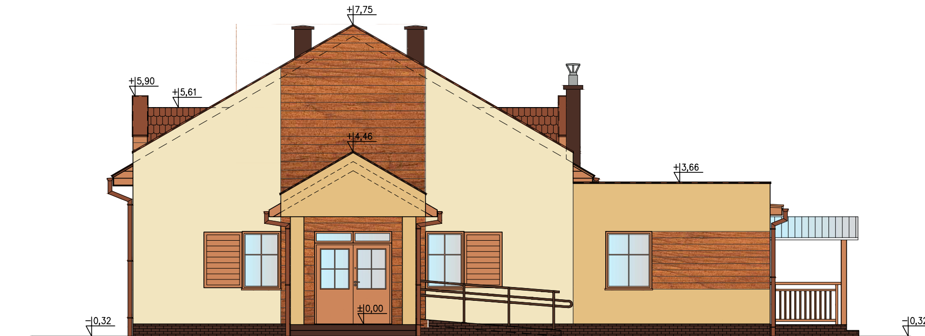
elewacja zachodnia, 1:100